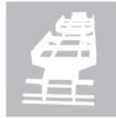
Estructuras de carrocerías